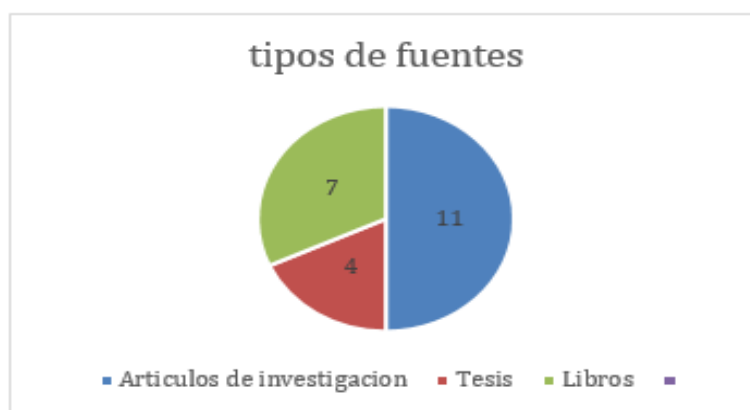
Figura 1. Cantidad de estudios por tipos de fuentes

Además, se encontró diversas teorías que sustentan el desarrollo socioemocional pero cada una con un enfoque distinto con respecto al comportamiento y a las relaciones interpersonales de los niños y niñas del nivel inicial. Algunas se enfocan en el desarrollo de la personalidad partiendo de la experiencia emocional a temprana edad y otras parten del contexto cultural, las influencia del exterior en el comportamiento. Cada tipo de fuente contribuyó a la obtención de información desde las definiciones de las teorías como también a las investigaciones realizadas para conocer la evolución de dichas teorías y/o nuevos descubrimientos. (Figura 2)