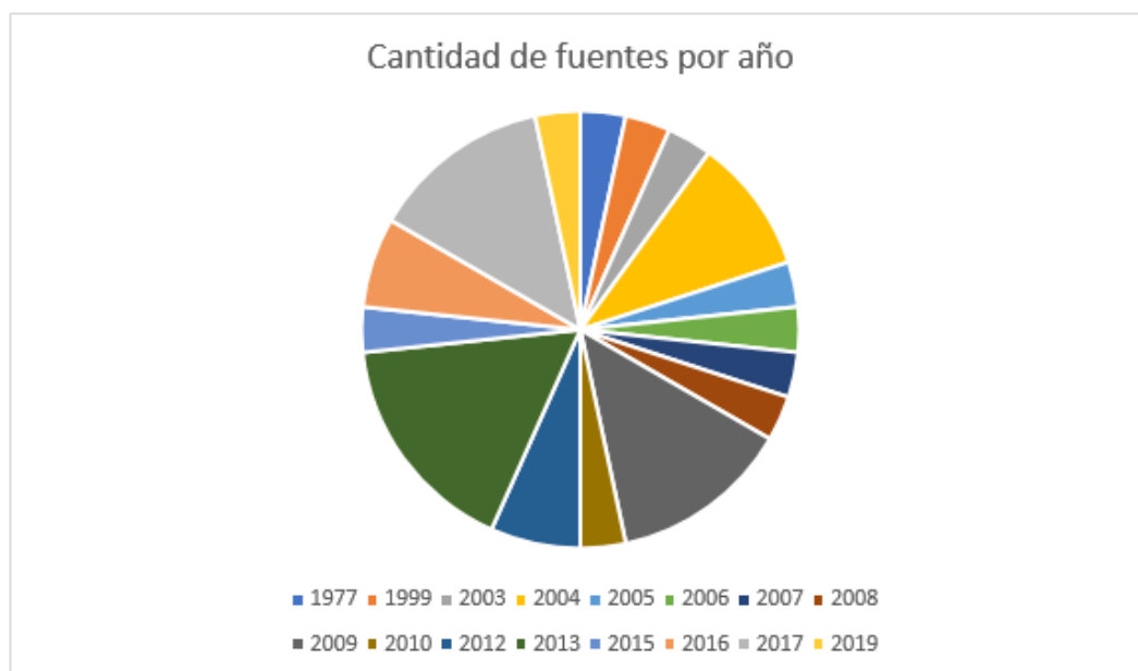
Figura 1. Cantidad de fuentes según los años